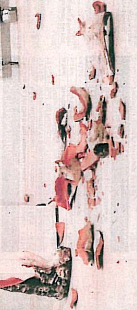
in elkaar zullen worden gezet. Starling: "Het is nooit mijn intentie om iets kapot te maken."